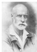
Alexandre Émile Jean Yersin

Sau h n 50 năm s ng và làm vi c vì khoa h c Vi n Pasteur Nha Trang (1891 - 1943) Yersin đã c ng hi n cho khoa h c 55 công trình nghiên c u có giá tr .