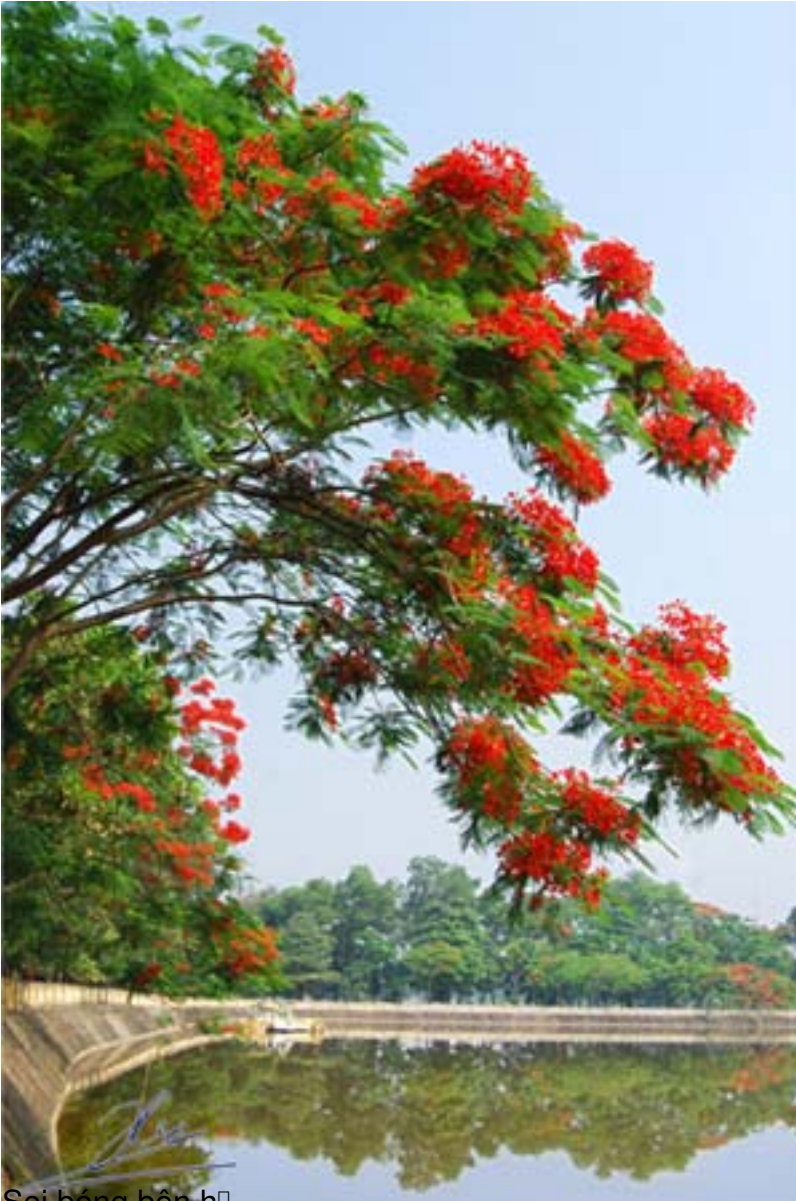
Sợi bóng bên hồ.

T&#225;c Gi&#7843;: saigon Echo s u t m Th&#7913; Ba, 28 Th&#225;ng 7 N&#259;m 2009 08:37