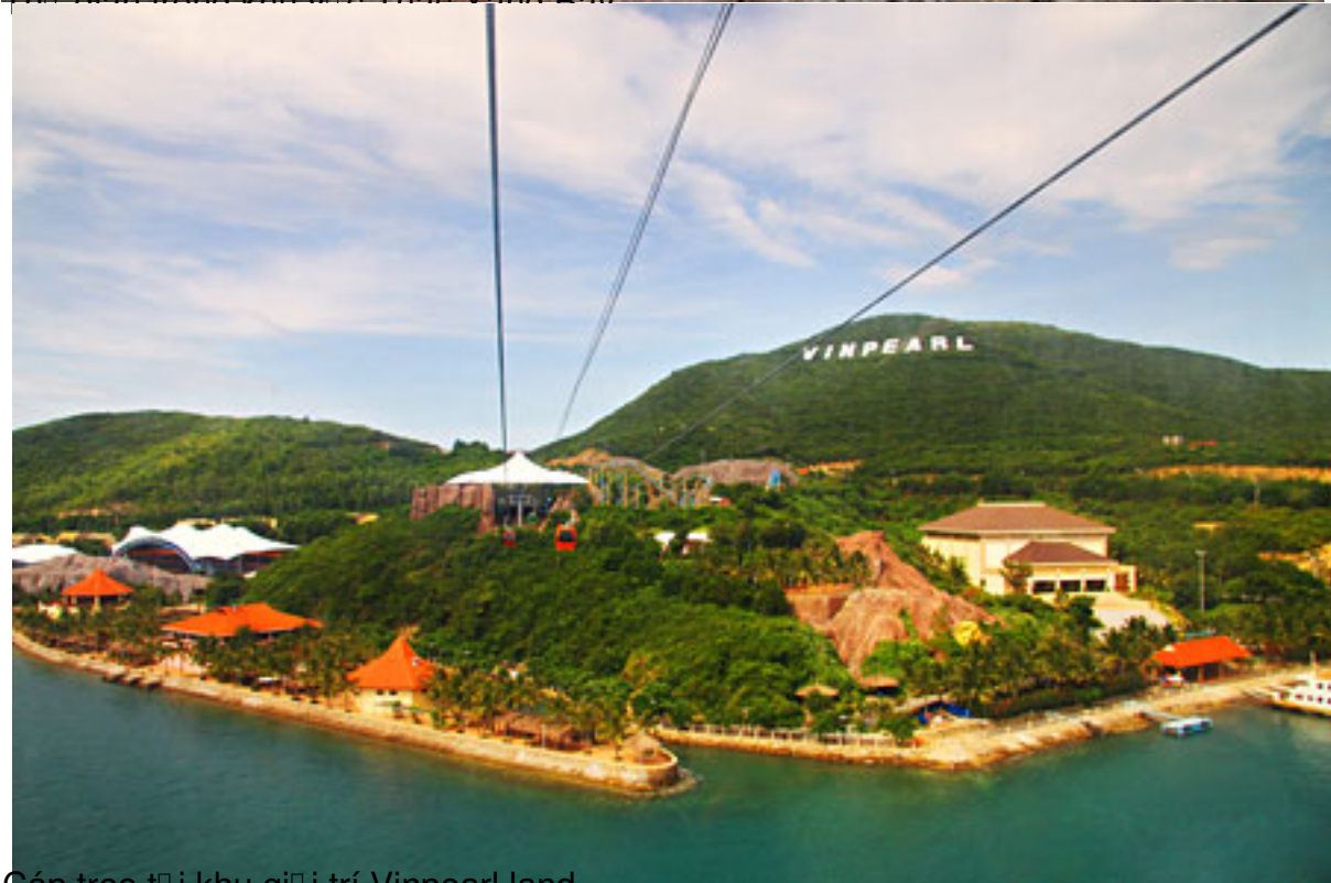
Cáp treo tại khu nghỉ trí Vinpearl land.