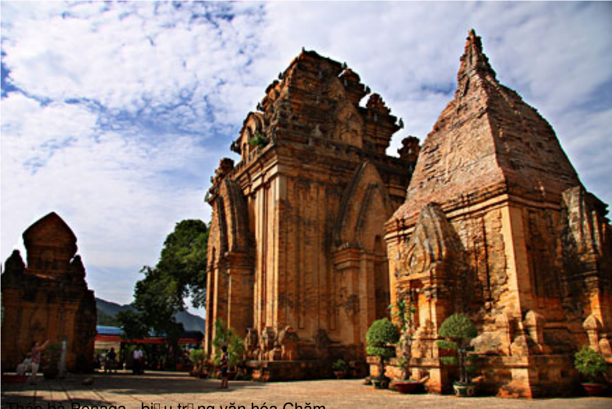
Tháp bà Banteay Srei - biểu trưng văn hóa Chăm

T&#225;c Gi&#7843;: saigon Echo s□ u t□ m Th&#7913; Ba, 28 Th&#225;ng 7 N&#259;m 2009 08:37