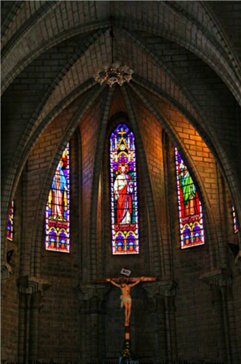
Trong Nhà thờ Đa - nhà thờ quý mô hình Nha Trang.

T&#225;c Gi&#7843;: saigon Echo s u t m Th&#7913; Ba, 28 Th&#225;ng 7 N&#259;m 2009 08:37