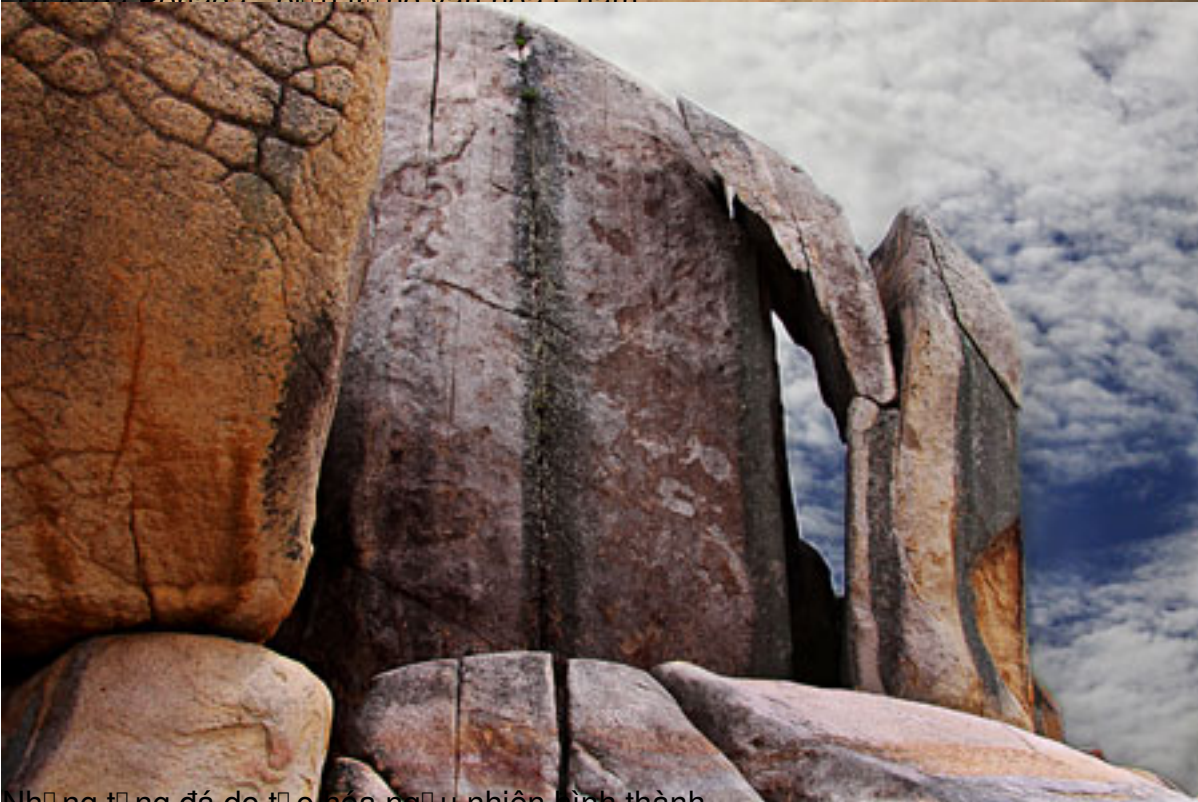
Những tảng đá do tác động của tự nhiên hình thành.