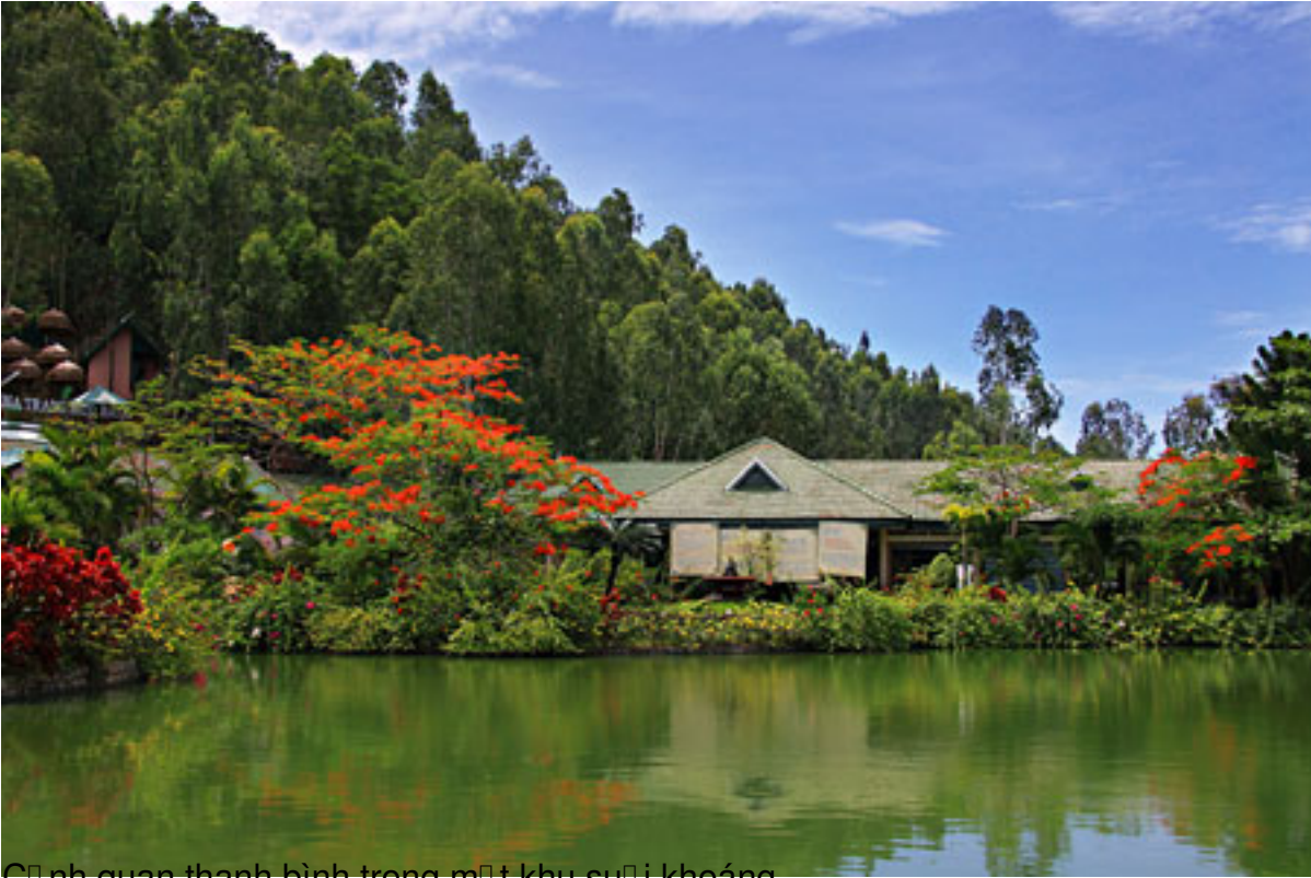
Chợ gạo thành bình trong m i khu cu i khoáa

T&#225;c Gi&#7843;: saigon Echo s u t m Th&#7913; Ba, 28 Th&#225;ng 7 N&#259;m 2009 08:37