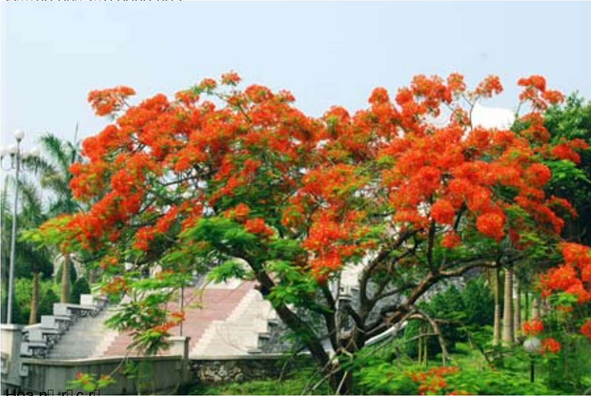
Hoa n r c r .