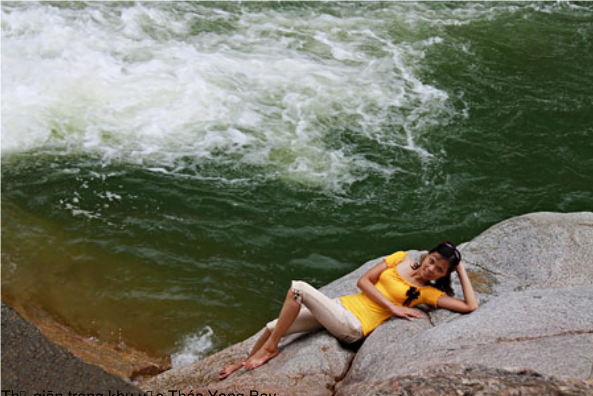
Thị trấn trong khu vực Thác Yang Bay

T&#225;c Gi&#7843;: saigon Echo s u t m Th&#7913; Ba, 28 Th&#225;ng 7 N&#259;m 2009 08:37