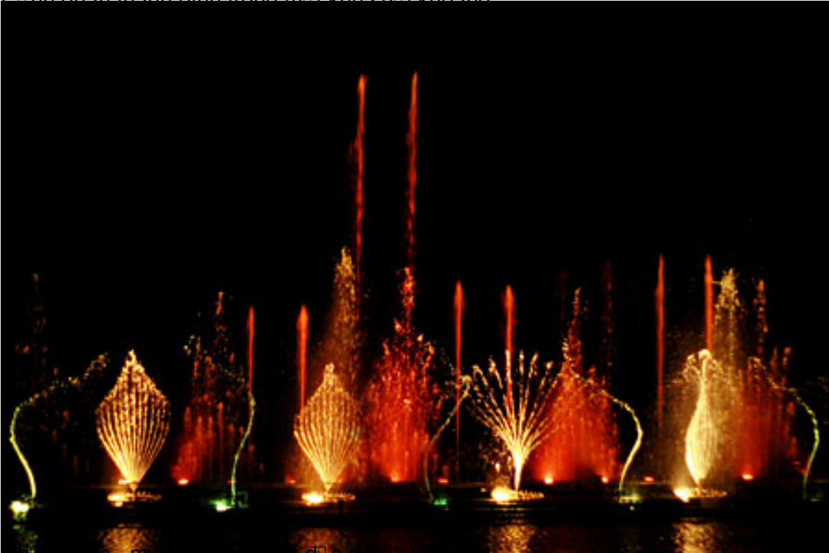
Nhà c hàu c - mặt chàu ng thm đ i c s i c u v i n p ean.