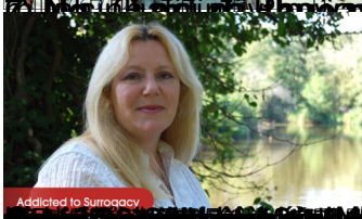
Addicted to Sunogasy