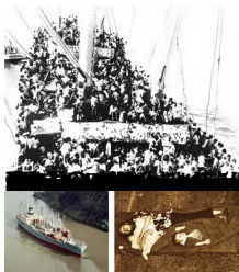
MS Clara Maersk (Denmark) Mother and children.

Th&#7913; S&#225;u, 09 Th&#225;ng 4 N&#259;m 2010 07:46