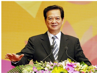
Thủ tướng Nguyễn Tấn Dũng: Hành động quyết liệt để vượt qua sức y của quá trình khởi động, đặt tiền trình phát triển của đất nước vào quỹ đạo mới - Quỹ đạo phát triển bền vững

Thông điệp đầu năm 2012 của TT Nguyễn Tấn Dũng rõ là có gây mất sự hi vọng về những đổi mới.